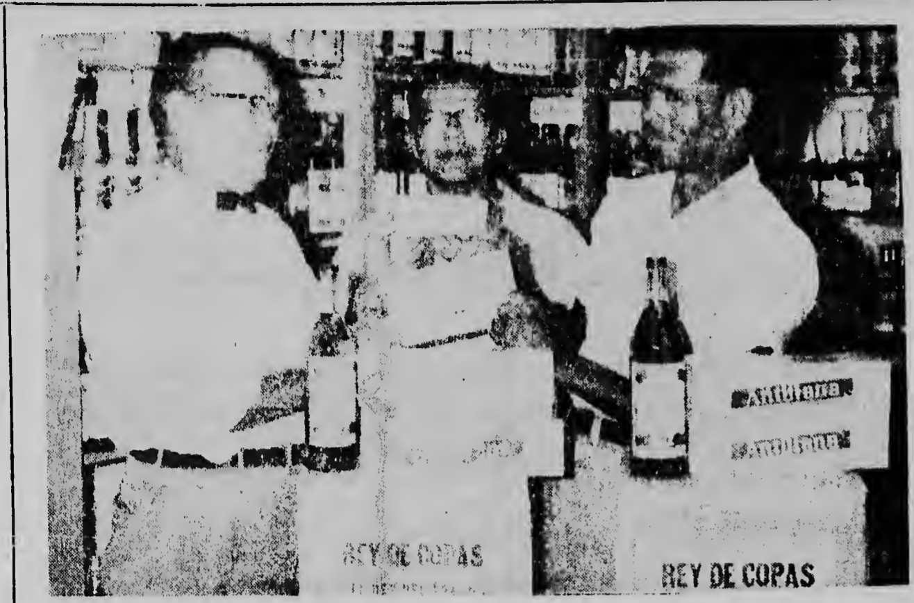
REY DE COPAS